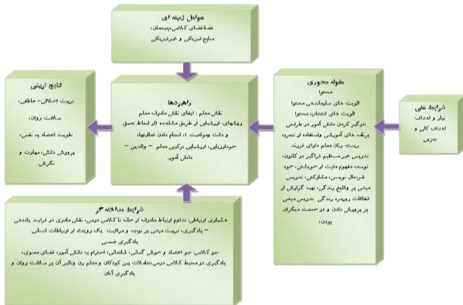
شکل ۱- مدل پارادایمی برنامه درسی مبتنی بر اخلاق مراقبت: تداوم نقش مدرانه در دوره ابتدایی

در ادامه، با استفاده از فرایند کدگذاری انتخابی، الگوی مفهومی نهایی برنامه درسی مبتنی بر اخلاق مراقبت در دوره ابتدایی نظام آموزشی ایران طراحی شد. در این مرحله، نظریه پرداز داده بنیاد برحسب فهم خود از متن پدیده مطالعه شده، در قالب پالایش مدل پارادایمی مرحله کدگذاری محوری و ارائه روابط مستتر در بین مقوله‌های موجود در مدل، نظریه خود را پیرامون پدیده محوری در قالب مجموعه‌ای از گزاره‌ها یا زیرگزاره‌ها ارائه داد. در این راستا پژوهشگر بر اساس تجارب و فهم خود از پدیده محوری مدل پارادایمی کدگذاری محوری یعنی (محتوا)، الهام از ادبیات نظری موجود و مصاحبه‌های مجدد با آزمودنی‌های پژوهش و دریافت نظریات اصلاحی متخصصان امر و استادان دانشگاه، الگوی مفهومی نهایی را ترسیم کرد. پس از تهیه الگوی نهایی و در راستای اعتبارسنجی آن، همچنان که اشاره شد از نظرات ۱۲ تن از زنان استادان دانشگاه و متخصص نیز استفاده شد، که الگوی مذکور مورد تأیید این افراد نیز قرار گرفت. شکل (۲) مدل مفهومی نهایی برنامه درسی مبتنی بر اخلاق مراقبت: تداوم نقش مدرانه در دوره ابتدایی بر اساس