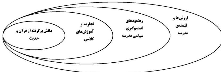
شکل ۱: محوریت قرآن و حدیث در فرآیند تدوین برنامه‌ی درسی آموزش سلامت جنسی - اقتباس از سانجاکدار (۲۰۰۶)

سانجاکدار ، لزوم توجه به پرورش انسان‌هایی خود ساخته که بتوانند در موقعیت‌های گوناگون با تقوای الهی عفت خود را حفظ کنند را از اساسی‌ترین اهداف تربیت اسلامی می‌داند (۲۰۰۴). البته از دیدگاه وی، در اغلب جوامع از جمله جوامع اسلامی این اعتقاد وجود دارد که فرزندان باید نسبت به ماهیت رشد جنسی خود آگاهی یابند. ماهیت مثبت و خدایی تمایلات جنسی گناهی نیست که باعث شرمندگی انسان شود (۲۰۰۵). در قرآن و احادیث تأکید زیادی بر کسب دانش در همه‌ی جنبه‌ها وجود دارد. در زمان پیامبر اکرم (ص) مردان و زنان مسلمان به راحتی در مورد مسایل شخصی از جمله مسایل جنسی خود، سؤالاتی را می‌پرسیدند (۲۰۰۵). اولیای دانش آموزان مسلمان در جست‌وجوی آموزشی هستند که اخلاقیات، اعمال، خصوصیات و رفتارهای اسلامی را حفظ نماید (۲۰۰۵). اما این که این کار توسط چه کسی و چه زمانی بایستی ارائه شود، موضوعی قابل مناقشه در میان اولیا، مربیان و فرزندان است. اضافه بر این‌که، بسیاری از دانش‌ها و اطلاعات جنسی مربوط به سلامت جنسی را می‌توان بر مبنای آموزش، اصول و عقاید اسلامی که مبتنی بر قرآن و حدیث است، ارائه نمود (۲۰۰۰). به عبارت دیگر، آموزش‌های اسلامی، قرآن و حدیث باید کانون تصمیم‌گیری‌ها تلقی شود (شکل ۱). در این نمودار از قرآن و حدیث، به عنوان منابع اصلی، اولین گام منطقی است: «قرآن، زندگی پیامبر و اهل بیت منابع بی‌آلایش و گشوده‌ای هستند که می‌توانیم پاسخ تمامی سؤالاتمان را در آن‌ها بیابیم. بنابراین بایستی به قرآن و حدیث برگردیم، آن‌چه را که درون آن است شناخته و در اختیار دانش‌آموزان قرار دهیم».