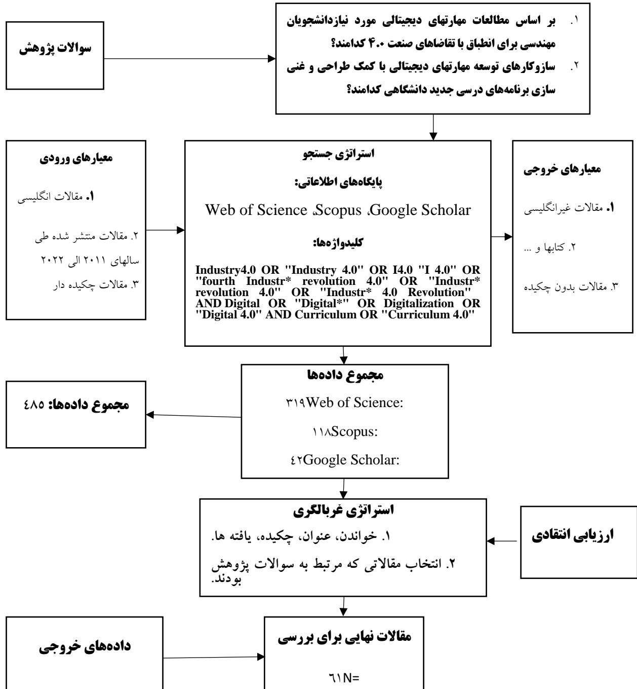
شکل (۱) الگوریتم انتخاب مقالات

مقاله کاهش یافت. در مرحله بعدی با بررسی محتوای مقالات باقیمانده و با توجه به نظر اساتید تیم پژوهشی، در نهایت تعداد ۶۱ مقاله، تأیید و نهایی شدند.